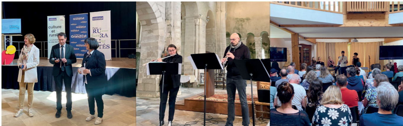
N°5 / 7 juin / Vic-sur-Seille (57)