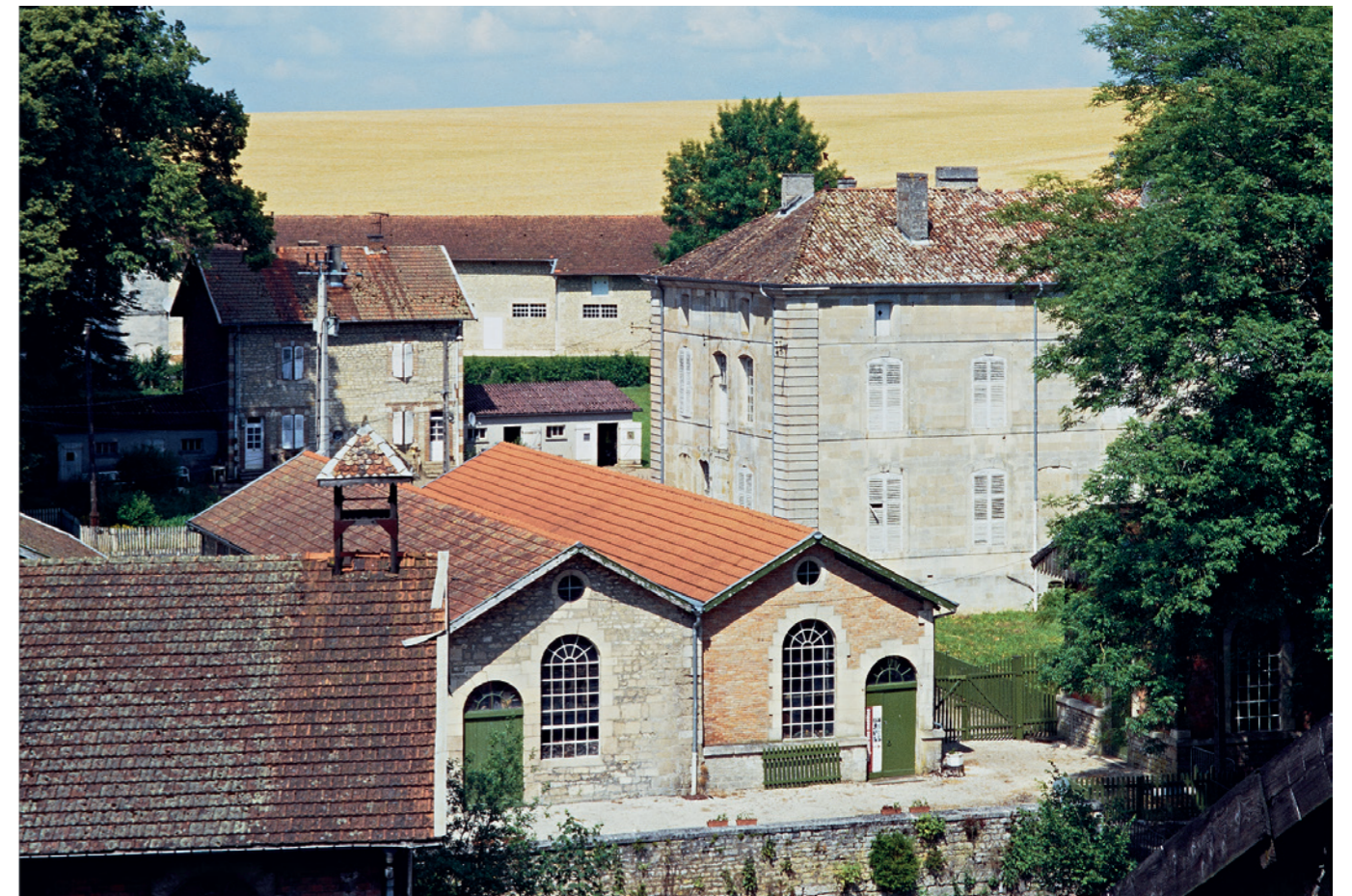
Écurey-en-Verdunois (55)

photo couverture: Anchamps (08)