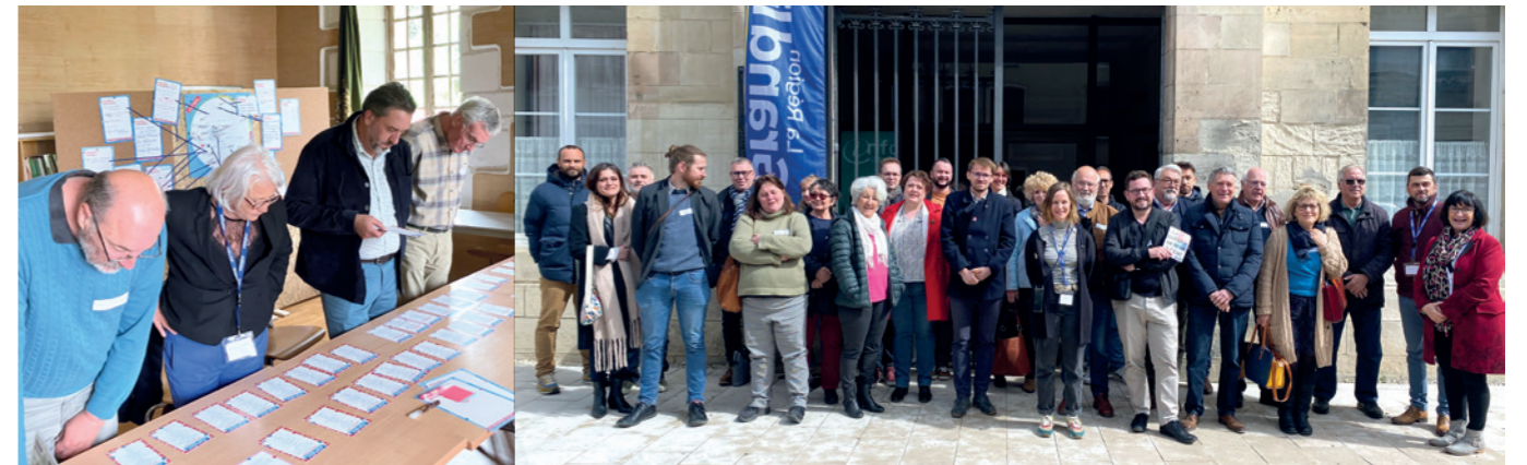
N°3 / 23 mai / Chenegy (10)