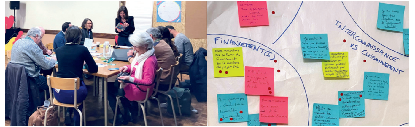
N°3 / 23 mai / Chenegy (10)