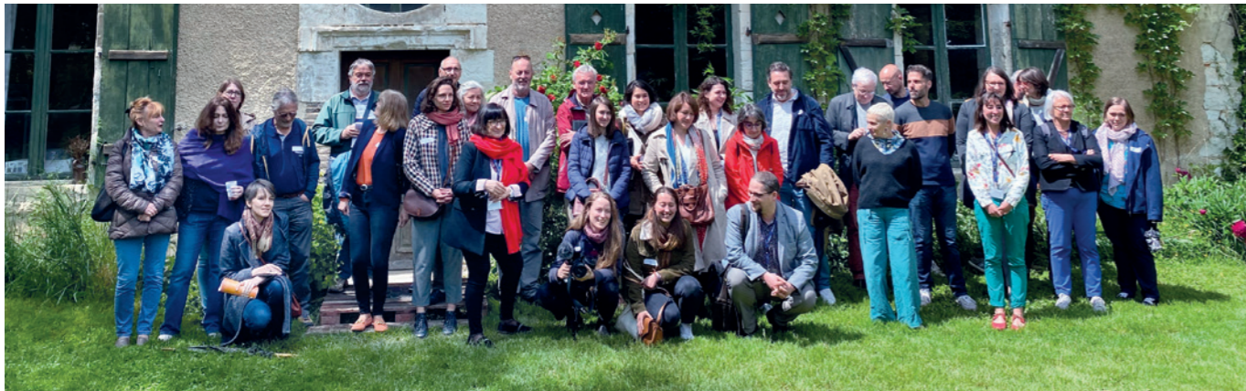
N°3 / 23 mai / Chenegy (10)