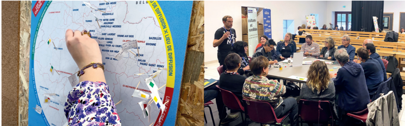
N°1 / 11 avril / Vouziers (08)