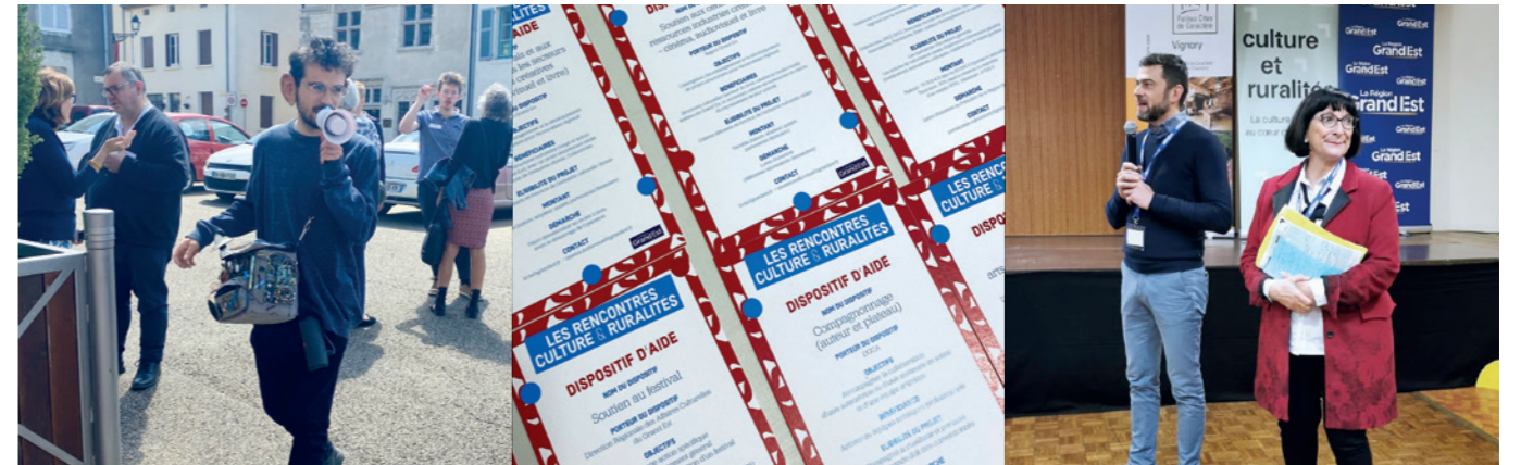
N°5 / 7 juin / Vic-sur-Seille (57)