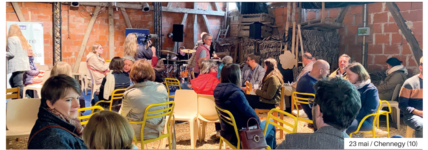
23 mai / Chennevy (10)

Des urbains en besoin de quiétude aux entreprises soucieuses de trouver de la compétence, en passant par les associations et les services publics, tout le monde doit pouvoir trouver en ruralité les conditions pour s'affirmer, se développer et se réaliser. Résultats économiques, nouveaux habitants, la ruralité est loin d'avoir perdu de son prestige et prouve même qu'elle crée de nouvelles formes d'attractivité. Forte des potentiels et des ambitions locales, la Région met en œuvre les moyens pour favoriser et encourager le dynamisme des ruralités.