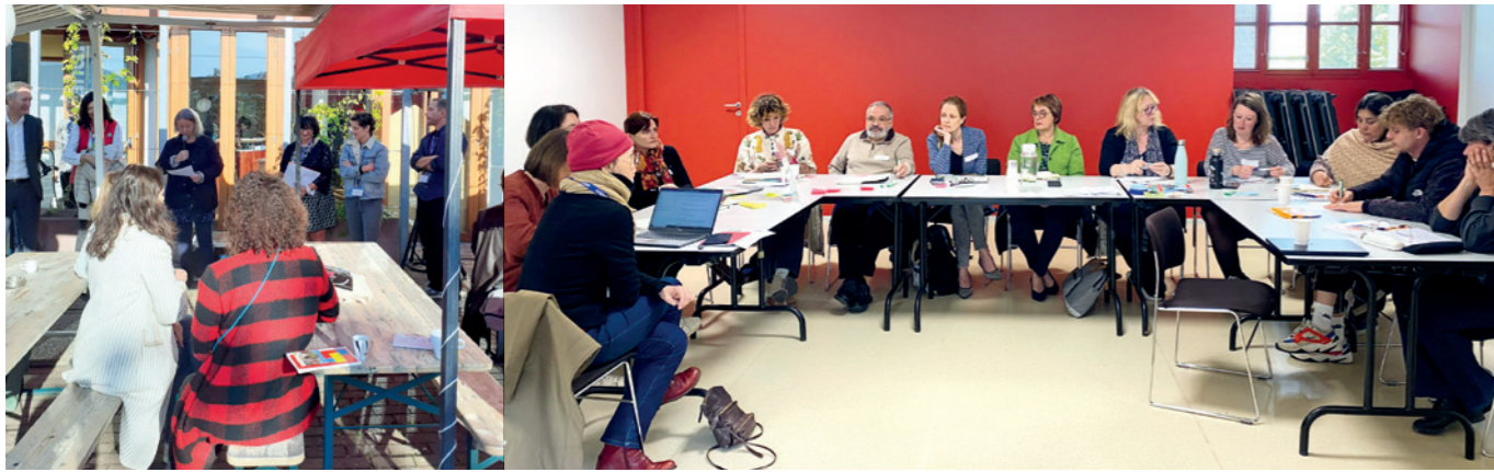
N°8 / 19 sept / Munster (68)