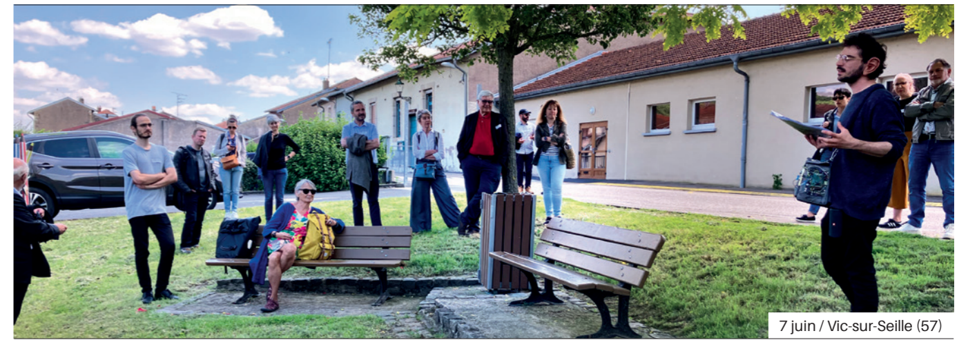
7 juin / Vic-sur-Seille (57)