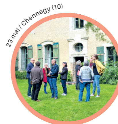
23 mai / Chennevy (10)

et aux modèles alternatifs qui répondent à de nouvelles logiques du « vivre autrement » portant des valeurs de solidarité à travers l'économie solidaire ou l'éducation populaire et qui rencontrent des difficultés à être compris par les politiques publiques « en silo » : déployer et repérer des financements adaptés en transversal en interne et entre les partenaires institutionnels, favoriser des espaces de création polymorphes partagés, rendre possible l'émergence de (tiers-)lieux culturels, travailler sur des dispositifs transversaux entre les différents services et favoriser les décloisonnements interministériels par des subventions croisées.