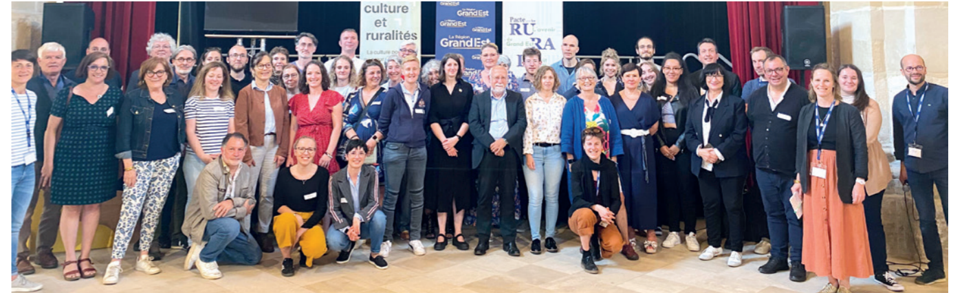
N°5 / 7 juin / Vic-sur-Seille (57)