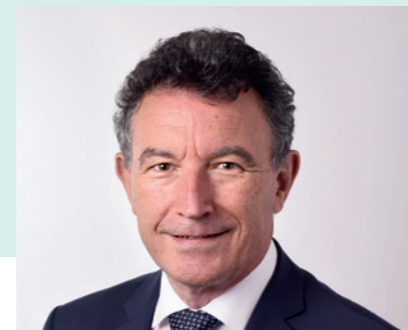
Franck Leroy Président de la Région Grand Est

Matérialisation de ce plan, LES 8 RENCONTRES CULTURE ET RURALITÉS ont permis, d'avril à septembre dernier, de proposer un temps de concertation aux acteurs du territoire du Grand Est. Animées par Scènes et Territoires et l'Agence culturelle Grand Est et organisées en lien avec le Printemps de la ruralité du Ministère de la culture, elles ont été des moments privilégiés de rencontre avec les communautés locales avec l'ambition d'« inspirer, informer, partager » pour accompagner au mieux les dynamiques culturelles locales et identifier les défis prioritaires pour le développement culturel des territoires ruraux. Des problématiques et des besoins, mais également des projets exemplaires ont pu être mis en lumière. C'est cette matière récoltée qui nourrit aujourd'hui le présent livrable ainsi que sa version augmentée numérique, et qui permettra surtout de repenser nos dispositifs et méthodes d'intervention et de soutien en ruralité, pour répondre aux attentes et aspirations exprimées, en articulation avec l'ensemble des partenaires institutionnels.